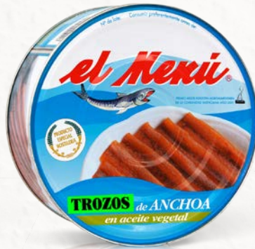
Lata de Trozos de Anchoa en Aceite de Girasol