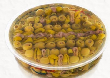
Banderillas Gildas en Aceite de Girasol