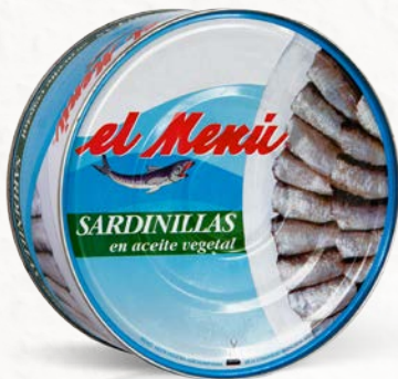
Lata de Sardinillas en Aceite de Girasol