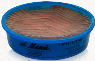
Filetes de Anchoa Argentina en Aceite de Girasol