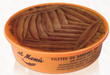
Filetes de Sardina Anchoada en Aceite de Girasol