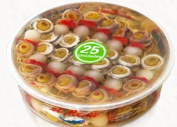
Banderillas Mixtas en Aceite de Girasol

Click sobre el producto para más información