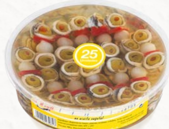
Banderillas de Boquerón en Aceite de Girasol