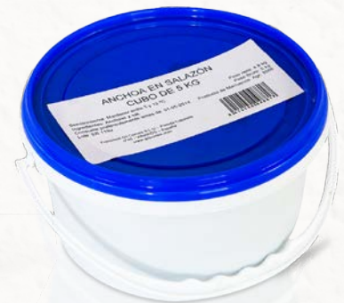
Cubo de Anchoa en Salazón