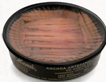
Anchoa Mediterránea en Mariposa en Aceite Girasol