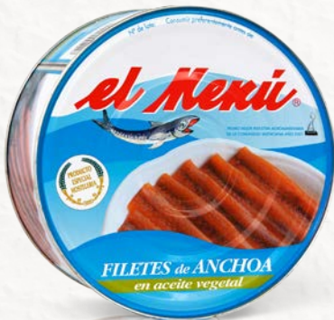
Lata de Filetes de Anchoa en Aceite de Girasol