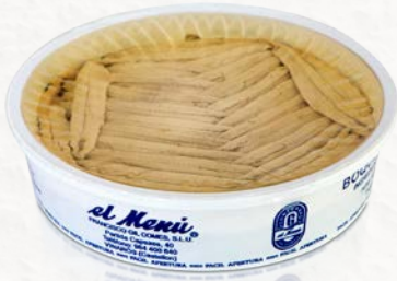
Boquerones al Vinagre