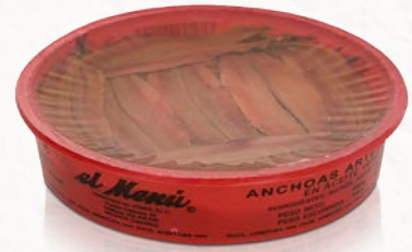
Anchoa Argentina en Mariposa en Aceite de Girasol